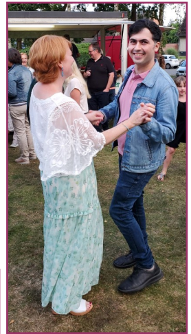
Es wurde getanzt und gelacht - und manchmal auch geweint...