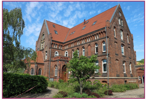
Bethel - Haus mit Kirche in Hannover